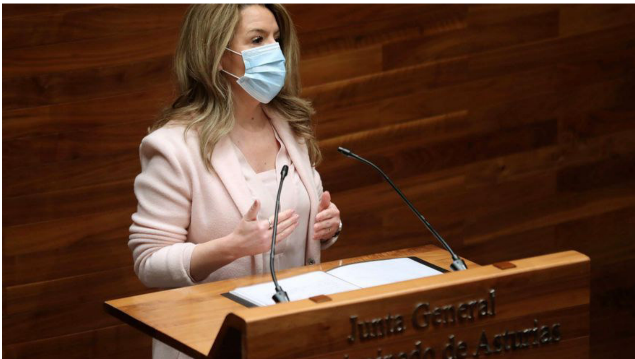
Mallada se querellará por injurias contra el presidente de Pladesemapesga