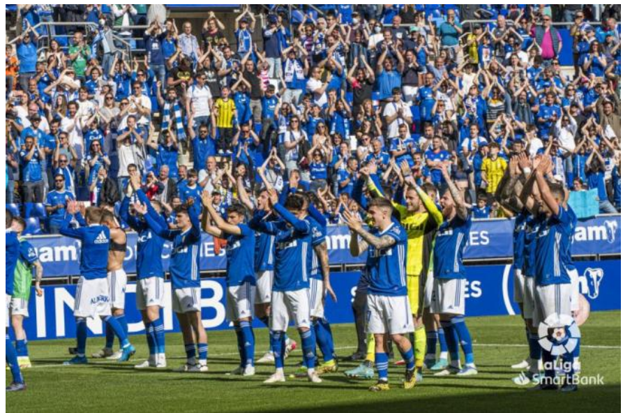
Comunión entre jugadores y afición tras ganar al Mirandés.

Jueves, 16 de Junio de 2022. 21:37 Actualizado: 16/06/2022 21:38