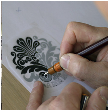
Modelos de decoración