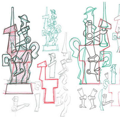
Bocetos Figura Quijote

joyerías que comercializan nuestros artículos en España y otros países.