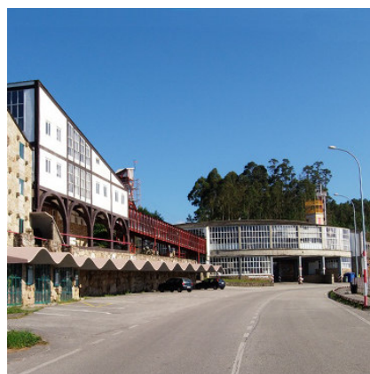
Fábrica de Sargadelos