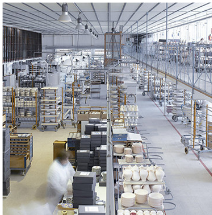
Interior Fábrica de O Castro